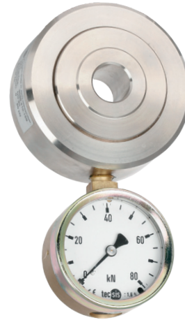
Гидравлический кольцевой преобразователь силы, модель F6116